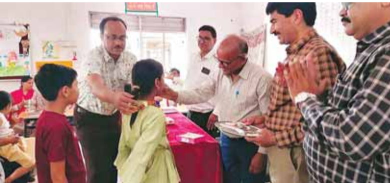
हरिभूमि न्यूज़ | कटनी

राज्य शिक्षा केन्द्र भोपाल के निर्देशानुसार सोमवार को जिले के विकासखण्डों में संचालित 1277 प्राथमिक शालाओं एवं 532 माध्यमिक शालाओं में स्कूल चलें हम अभियान अंतर्गत प्रवेशोत्सव