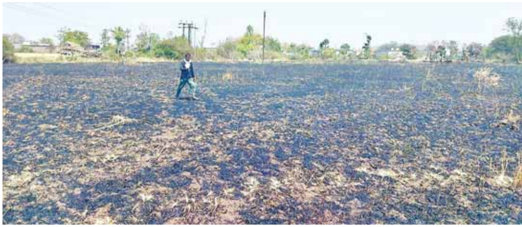
हरिभूमि न्यूज़ | डीमरखेड़ा

गर्मी का मौसम शुरू होते ही आगजनी की घटनाएँ होने लगीं। सोमवार को डीमरखेड़ा तहसील मुख्यालय के पीछे खेतों में गेहूँ की खड़ी फसल में आग लग गई। देखते ही देखते आग तेजी से फैलने लगी और करीब 7 एकड़ की खड़ी गेहूँ की फसल जलकर खाक हो गई। आग को बुझाने के लिए कई ग्रामीण खेतों में उतर पड़े और आग बुझाने की कोशिश करते रहे हालांकि फायर